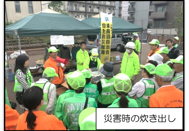
災害時の炊き出し