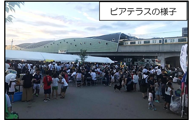
ピアテラスの様子

本公園が整備されたことにより、ペアテラスと一体となった様々なイベントが開催され、賑わいが生まれてきております。