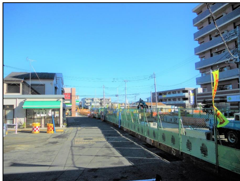
(写真①) 駅北口稲城長沼駅前通り線の現況①