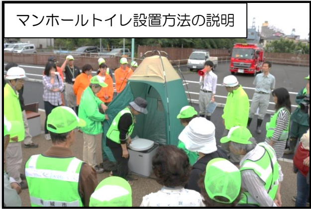
マンホールトイレ設置方法の説明

(※)『稲城市公共施設アダプト制度』とは、市が管理する道路、水路、公園、緑地などの公共施設を、市民の皆様が義務的活動ではなく、自らの活動と責任で、市と協働で管理する制度です。ご興味がある方は、土木課 緑と公園係(内線336・337)までお問合せください。