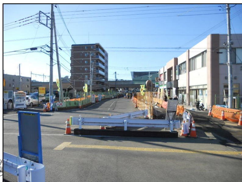
(写真②) 駅北口稲城長沼駅前通り線の現況②

昨年度は「稲城長沼駅前通り線」（多3・4・14号線）の高架下部分及び公園3号（いなぎペアパーク）の整備をいたしました。今年度は昨年度に引き続き、「稲城長沼駅前通り線」（多3・4・14号線）の北口タクシー乗り場前から9m道路まで整備する工事を令和元年10月30日より実施しています。なお、工事期間中の令和元年12月16日から令和2年2月末（予定）までの間は、北口にあったタクシー乗場を南口暫定駅前広場に移動させています。