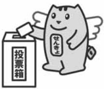
表1 郵便等投票ができる方

候補者の経歴や政見を掲載した選挙公報は、公示日以降、各戸配布でお届けします。また、6月28日(火)頃から「東京都の参院選特設サイト」でもご覧になれる予定です。