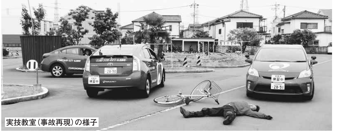
実技教室(事故再現)の様子

秋の全国交通安全運動が実施されます。この運動を機会に家庭、学校、職場などで改めて交通安全について話し合い、悲惨な交通事故を防止しましょう。