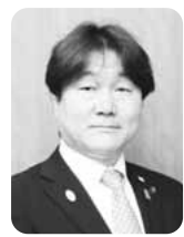
稲城市長 高橋 勝浩

科学技術の発展については、日米では科学自体の発展のために研究政策を立てています。が、その他の国では経済発展のために進んでいるという見方もあるようです。真偽はともかくとして、日本では1995年に科学技術基本法を制定以来、巨額の資金を基礎研究に投資してきており、その成果が現れているようです。ノーベル賞受賞総数は欧米にかなわないものの、2000年以降の自然科学分野では日本の受賞が相次ぎ、一定の存在感を示しています。日本は研究費も多く、世界との情報ネットワークも強いので、更に期待できるとの意見もあります。