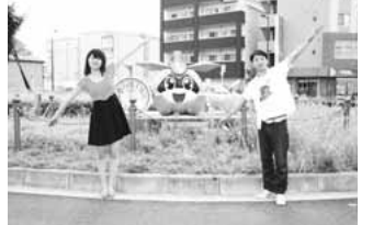
稲城市PR動画を制作しました