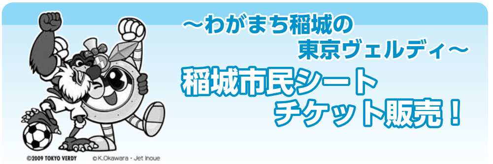
表2 稲城市民シート販売協力店一覧