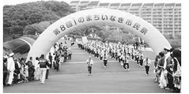
Iのまち いなぎ市民祭

発行 東京都稲城市 編集 秘書広報課広報広聴係 〒206-8601 東京都稲城市東長沼2111 ☎042-378-2111 ☎042-377-4781