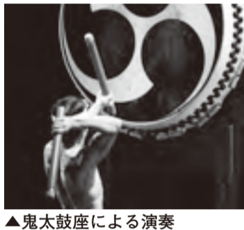
▲鬼太鼓座による演奏