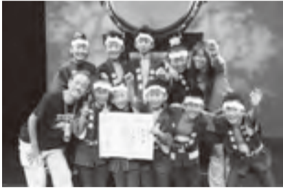
▲見事に偉業を成し遂げた鼓遊の皆さん

8月14日に「こどもの城 青山劇場」で開催された第九回東京国際和太鼓コンテスト組太鼓青少年の部において、鼓遊が最優秀賞を受賞しました。