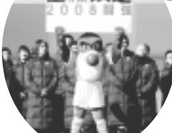
ヴェルディのスローガン「全緑疾走2008闘強」

稲城市をホームタウンとする東京ヴェルディ。2007年シーズンはラモス監督指揮のもと、開幕後の7連敗を見事はね返し、J2リーグ第2位でJ1復帰を果たしてくれました。2008年シーズンは柱谷新監督が就任し、元日本代表の福西選手や土肥選手などベテラン選手も多く新加入しました。新生ヴェルディが巻き起こす「緑の旋風」で、さらなる躍進が期待されます。「わがまち稲城のヴェルディ」と、市民に親しまれ愛されるチームを目指して頑張るヴェルディを応援し、選手に熱い声援を送りましょう。