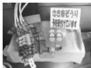
裂き布ぞうりを作りませんか。

みなでごみを減らそう! 生かそう! 考えよう! 古布のリサイクル 裂き布ぞうり作り 講習会 費用 200円 定員 5人(先着順) 出店者募集 フリーマーケット 裂き布ぞうり作り 講習会 裂き布ぞうり作りをしませんか。 こまもの問屋の出店者を募集します。 利用期間 3月15日(土)～31日(月) 募集数 10人(先着順) 共通事項 申し込み・問い合わせ 稲城市リサイクルショップ ☎379・5374 日・月曜日と祝日は休みです。