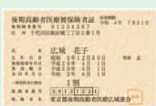
▲新しい被保険者証

なお、限度額適用・標準負担額減額認定証、限度額適用認定証も更新です。既に交付されていて、8月以降も対象となる方には、新しい認定証を7月下旬に送付します。