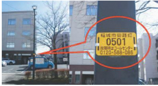
▲街路灯はコールセンターへ

ター」 ㊟ をご覧ください。お問い合わせください。 ☎市立病院健診科健診係 377-0931 予防接種 BCG(結核) 対接種日現在、生後1歳に至るまでのお子さん ※生後5〜8カ月が標準的な接種時期です。 ※対象年齢を過ぎると自費となります。 ㊟7月30日(木) ㊟午後1時30分〜3時 ※駐車場には限りがあります。 持母子健康手帳、予約票、バスタオル(子ども寝かせ用) ㊟保健センター ☎378-3421