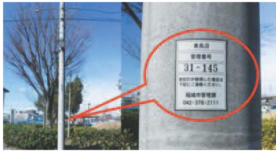
▲防犯灯は市役所管理課へ

不点灯などの不具合を発見した際は、電柱に記載の連絡先へ、管理番号・不具合状況をご連絡ください。 不具合を発見した際の連絡先(左写真参照) ○街路灯⇨コールセンター ☎0120-588-086(フリーダイヤル) ○防犯灯⇨管理課 ㊟管理課維持補修係