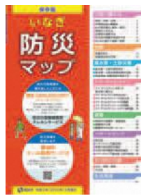
▲いなぎ防災マップ

避難とは「難」を「避」けることであり、安全な場所にいる人まで避難所に行く必要はありません。災害発生前に、自分が住んでいる地域にどんな危険があるのかをハザードマップで確認しておきましょう。ハザードマップは3月に全戸配布した「いなぎ防災マップ」または市HP内「いなぎハザードマップWeb版」で確認できます。いなぎ防災マップは市HPからもダウンロードできます。 災害時は市HPにアクセスが集中するため、ハザードマップ等は事前にダウンロードして確認してください。