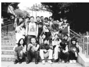
▲去年10月のバスハイク(上野公園にて)