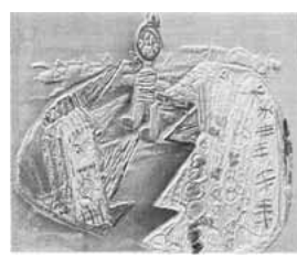
稲城市立平尾小学校なかよし学級の皆さんの作品です。