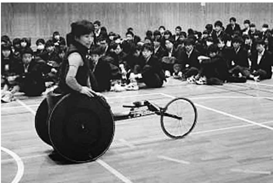
▶稲城第一中学校・第三中学校 野沢温泉村での活動風景 (平成28年1月12日～15日実施)