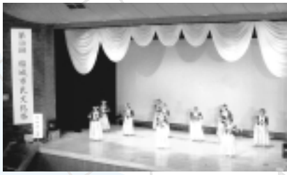
▲カフリ ナオラニ フラのダンス (昨年度)