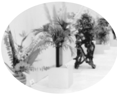
▲芸術祭の展示 (昨年度)

○展示部門 開催期間 10月23日(金)～25日(日) 会場 総合体育館 メインアリーナ