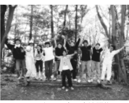
▲ふれあいの森で宿泊研修

イ稲城グリーン駅伝大会事務局 〒206-0802 稲城市東長沼2120 の6の104 ☎(379)2585、☎(379)199 Eメール eikiden@nspojp