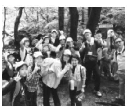
▲川俣溪谷ハイキング

前に、夏休み期間中に稲城を離れてのキャンプなどを行います。 対象 小学5年、中学3年生 定員 50名程度(申込多数の場合は抽選になります。) 参加費 二、〇〇〇円 宿泊費は別途(一五、〇〇〇円前後) 申込締切 4月28日(火) 所定の用紙に記入し生涯学習課まで郵送(28日必着)または直接提出願います。 電話での受付は行いません。 申込用紙は、生涯学習課のほかに、各学校・文化センターに