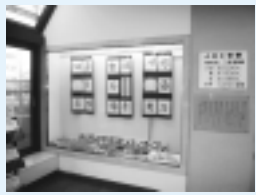
市民ギャラリー の展示風景

8月以降の作品展示希望者を募集 します。個人・団体いずれでも結構 です。費用は無料です。 場所 市役所1階ロビー 期間 約1ヶ月単位 サイズ 高さ170cm・横幅250cm・ 奥行55cm(縦が190cm、幅が65cmの ドアから搬入) 搬入・搬出・展示は、各自で行っ ていただきます。 連絡先 生涯学習課(内線634) 芸 文連事務局 連絡は午後1時以降にお願いします。