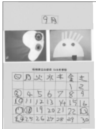
稲城第三小学校いなかほ学級の皆さんの作品です。

編集・発行 稲城市教育委員会生涯学習課 〒206-8601 稲城市東長沼2111 電話 042-378-2111 FAX 042-379-3600