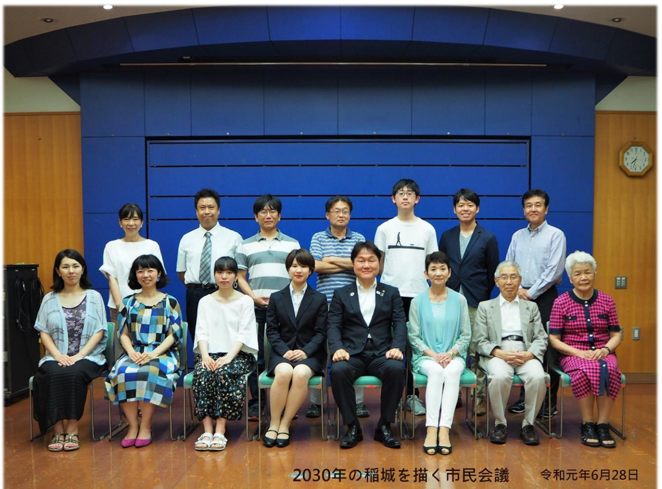
2030年の稲城を描く市民会議