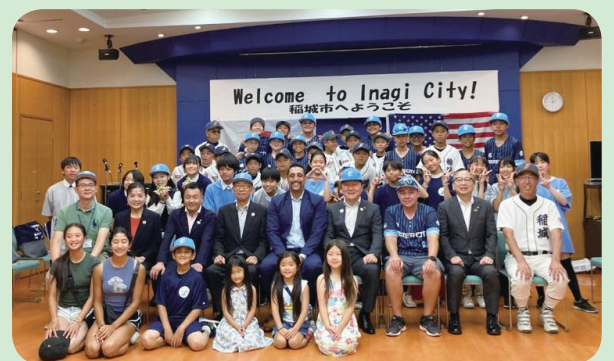
歓迎レセプション後の集合写真