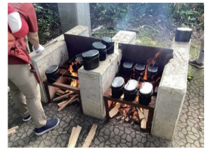
薪を使っての火起こしや火力の調整に苦労しました。