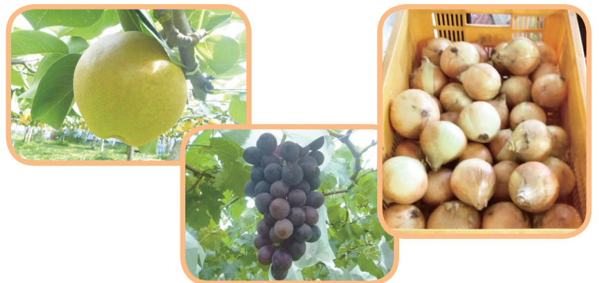
▷問合せ 学校給食課

稲城市の学校給食では市内農家のみなさんの協力とJA東京みなみとの連携により、稲城市産農産物を積極的に提供しています。給食で使用する食材は日本全国から届きますが、稲城市で生産された食材は共同調理場への輸送距離と時間が大幅に削減されるため、より新鮮なものが届きます。 例えば、令和5年度に使用した玉ねぎのうち、稲城市産のものは5,080kgでした。これは学校給食で提供した玉ねぎの約1割に相当します。 また、長ねぎ、大根も稲城市産のものを1,000kg以上学校給食で提供しました。その他の野菜では、白菜、にんじん、トマト等も使用し、じゃがいもは6月19日(水)の「食育の日」に合わせて市内農家の方に依頼して納めていただいています。 さらに、秋には稲城市が誇る特産品の高尾ぶどうと新高梨を提供し、子どもたちの味覚を育てています。 「稲城の子ども達にぜひ食べてもらいたい」という熱い想いを胸に、市内農家のみなさんは野菜や果物一つ一つを大切に育てています。これらの地元の恵みを、今後も可能な限り学校給食で提供し、子ども達の健やかな成長をサポートしていきます。