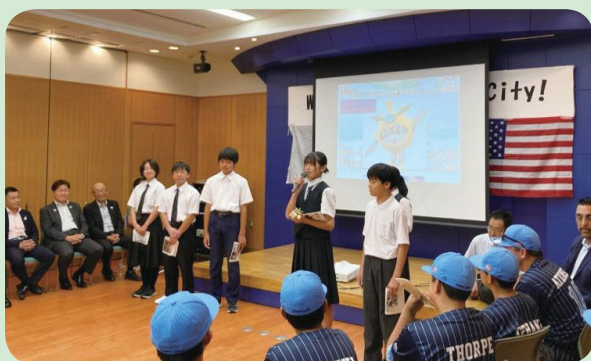
稲城市立中学校代表生徒によるウェルカムスピーチ