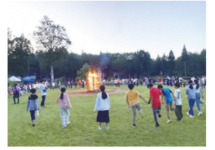
歌やダンス、ゲームを思い切り楽しみました。

冬は、雪で景色が一変する白銀の世界になります。野沢温泉村はスキー場としてとても有名で、過去にはオリンピックが開催されている場所です。来年訪れた際には、再び大自然のすばらしさを実感することでしょう。