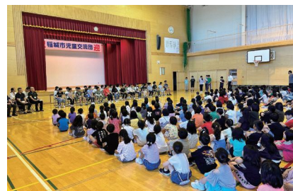
女満別小学校全校児童に歓迎していただきました。

参加した児童は、3日間の教育交流を通して、他地域の人々との触れ合いの機会に積極的・自主的に参加することができました。また、大空町を中心とした北海道の豊かな自然に触れ、自然に親しみ、自然を愛する思いを深めることができました。来年1月には、女満別小学校の児童が稲城市の小学校を訪問します。心からのおもてなしを行い、稲城の良さを紹介することを通じて、故郷である稲城の良さを再確認する機会となることを期待しています。