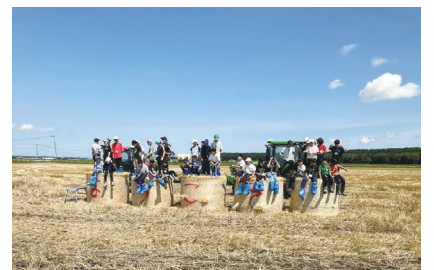
麦ロールの上に乗って女満別小学校の児童と一緒に記念撮影をしました。