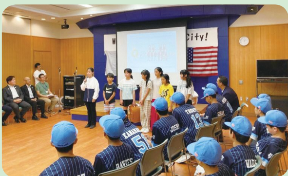
稲城第四小学校代表児童によるウェルカムスピーチ