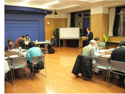
写真は今回の市民会議の様子

今回は、分科会および全体会で「市民会議提言書(中間取りまとめ)」の最終確認をしました。その後、分科会に分かれてこれまで仮称だった各分科会の名称および市民会議の名称等について話し合いました。この市民会議で分科会の名称および市民会議の名称については、次回の市民会議でもう一度話し合って決定します。