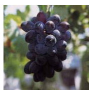
稲城の特産品：ぶどう

稲城市企画部長期総合計画担当 ☎206-8601 稲城市東長沼 2111 ☎042-378-2111 内線 537