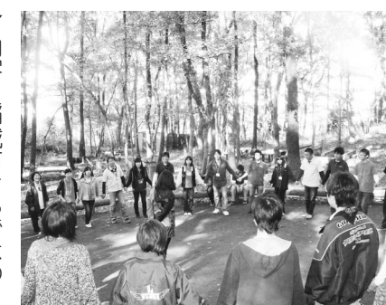
▲青年リーダー交流会

▽申込み 生涯学習課、各文化センターにある申込用紙に必要事項を記入の上、生涯学習課に提出してください。(8時30分~17時15分、ただし土、日と平日の12時~13時を除く) ▽申込期限 4月26日(金) ▽主管 稲城市青少年委員会 ▽申込・問合せ 生涯学習課