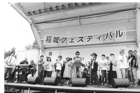
▲去年のフィナーレ風景(出演者全員のセッション)

る真夏の音楽祭典「稲城フェスティバル」を7月下旬(予定)に開催します。開催に向け、元気・やる気・活気あふれるバンドと、裏方で支える実行委員を募集します。 《出演希望バンド》 ▽対象 ①18歳以上で市内在住・在勤・在学の方が中心となって活動しているグループバンド。 ②実行委員会に1名以上必ず出席できるバンド。 《実行委員》