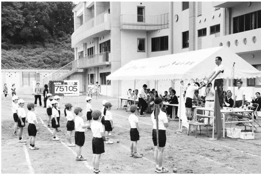
▲南山小運動会の閉会式

朝は、全児童と一緒に登校します。強い日差しや大雨の日の上り坂は大変ですが、上級生は