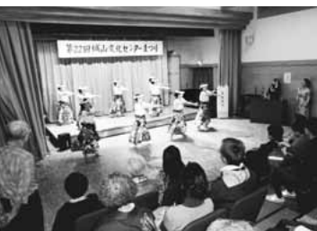
▲練習の成果をステージで(昨年度)

城山文化センターを拠点に活動しているグループが「まつり実行委員会」を組織し、展示・ステージ発表会・模擬店など、楽しさいっぱいの催しを行います。また15日(日)に城山児童館まつりも開催します。