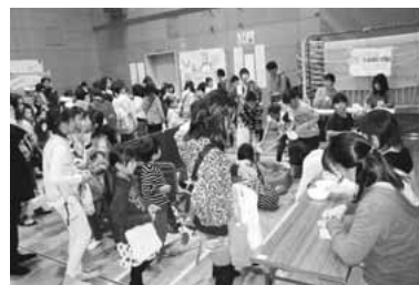
▲児童館まつり(昨年度)