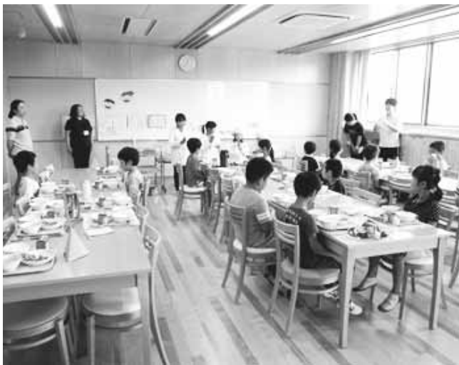
▲ランチルームでの給食