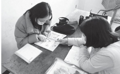
がくしゅうしゃの にーずにそつて たのしくべんきょうしています。

▷うけられるひと いなぎしにすんでいる、いなぎしではたらいっている、いなぎしがっこうにかよっている、ちゅうがくせいじょうのがいこくじんのかた ▷さんかひ 1かげつ300えん ▷おしえてくれるひと いなぎにほんごぼらんでいあのかい ▷といあわせ ちゅうおうこうみんかん