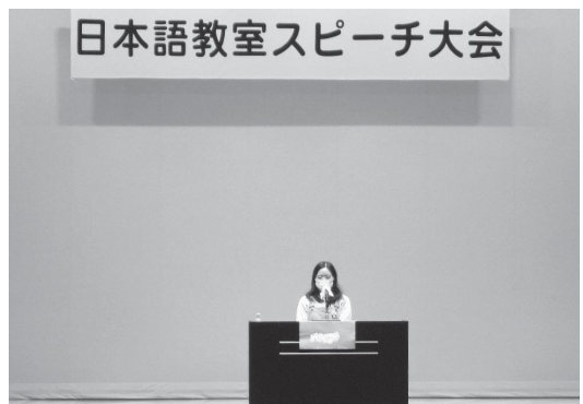
日本語教室スピーチ大会

公民館で学んだ成果として、学習者の皆さんが日頃感じていることを日本語で発表します。故郷を離れて日本に来て外国人がどのようなことを考えているのかを知って、新たな交流のきっかけにしてください。 ▽期日 11月26日(土) ▽時間 午前10時~正午 ▽会場 中央文化センター ▽対象 どなたでも ▽参加費 無料