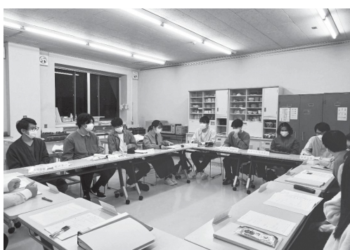
実行委員会の様子

式典開始前には、実行委員作成のオープニングムービーやスペシャルゲストからの祝いメッセージも準備しています。式典に参加される方は楽しみにしてください。