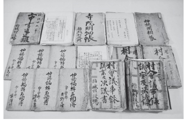
近代行政資料 (稲城市指定文化財)

編集・発行 稲城市教育委員会教育部生涯学習課 〒206-8601 稲城市東長沼2111 ☎042-377-2121 042-379-0491