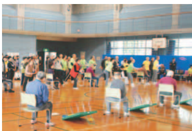
▲仲間たちと交流し、元気に楽しもう