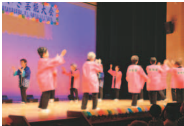
▲発表の機会ではつらつとした時間を過ごしましょう