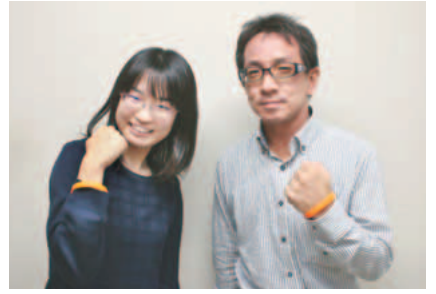
▲オレンジリングがサポーターの証