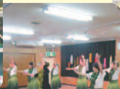
日頃の練習の成果をぜひご覧ください。