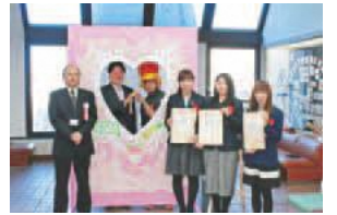
市役所1階に「ハッピーペアボード」を設置(8面へ)