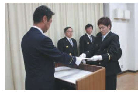
▲第八分団の三ヶ尻団員

市では、消防団活動に真摯かつ継続的に取り組み、地域社会に貢献した大学生などに対して功績を認証し、就職活動を支援するため「稲城市学生消防団活動認証制度」を実施しています。