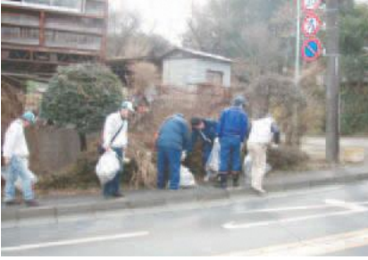
▲クリーンキャンペーンの様子

稲城市まちをきれいにする市民協議会と長峰連合会で「稲城市まちをきれいにする市民条例」啓発のための清掃活動を行います。