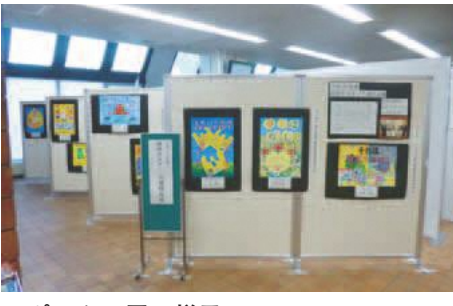
▲ポスター展の様子

2月4日(日) ※雨天中止 時午前9時～11時ごろ 集合場所 総合体育館玄関前 ※ごみ袋、軍手は市で用意 環境課環境保全係