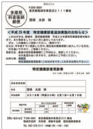
▲受診券見本（ハガキサイズ）