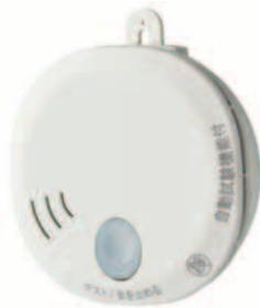
▲住宅用火災警報器

住宅用火災警報器は全ての住宅に設置が義務付けられています。設置状況の調査と設置後の適切な維持管理のため、市内全域の住宅を対象に調査を実施します。 ※調査は消防職員が身分証明書を持って伺います。 ☎5月1日(金)~6月30日(火) ☎予防課調査指導係 ☎377-7119