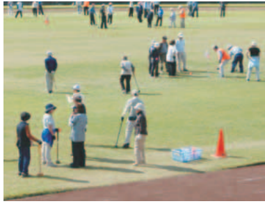
▲グラウンドゴルフ大会

みどりクラブは「友達が好き」「色々なことにチャレンジしたい」「生涯健康」等の思いで集まっているグループです。