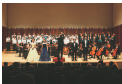
▲楽しく第九を歌う会演奏

Iのまちいなぎ市民まつりでの演奏に向け、合唱団員を募集します。本年は新型コロナウイルス感染症の状況を鑑みて9月から練習開始です。皆さんぜひご参加ください。 対中学生以上の方 定ソプラノ40人、アルト40人、テノール35人、バス35人 費5千円(楽譜代別) 申フックス、メール ※申込用紙は各文化センター、地域振興プラザで入手可 練習について(全7回) ▽初回練習日 9月7日(月)