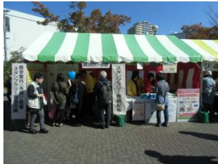
昨年のくらしフェスタの様子

くらしに役立つ情報の発表のほか、フリーマーケット、音楽ライブ(地域で活躍するミュージシャン達のライブイベント)も行います。是非ご来場ください。