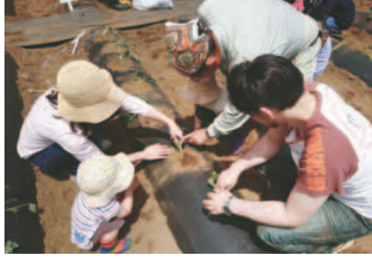
▲家族で楽しみましょう

※初回参加必須、収穫は秋頃を予定 午前9時45分〜11時ごろ 場 上谷戸大橋南停留所近くの畑(坂浜) ※駐車場無し 定30組 ※申込者多数の場合は抽選し、当選者には5月17日(金)までに案内を通知 費1組500円 申はがき(必要事項①住所②氏名③年齢④電話番号) ※「さつまいも体験農業参加希望」と明記 限5月10日(金)消印有効 先問 JA東京みなみ稲城支店指導経済課(〒206・082稲城市東長沼2110の1) ☎377・6002