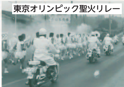
東京オリンピック聖火リレー