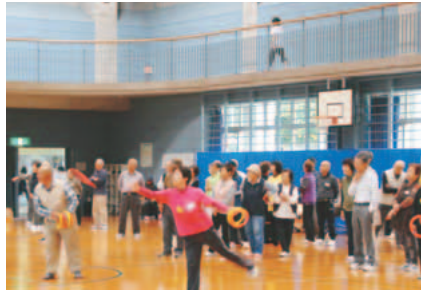
▲輪投げ大会の様子

みどりクラブは「友達が集まると色んなことにチャレンジしたい」「生涯健康」などの思いで集まっているグループです。グラウンドゴルフ、スナッグゴルフ・レクダンス等の軽スポーツ活動、カラオケや民謡、手芸、友愛活動に取り組んでいます。