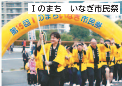
Iのまち いなぎ市民祭

明治30年に建てられた村役場は、1階が事務室、2階が村議会の議場として使われました。