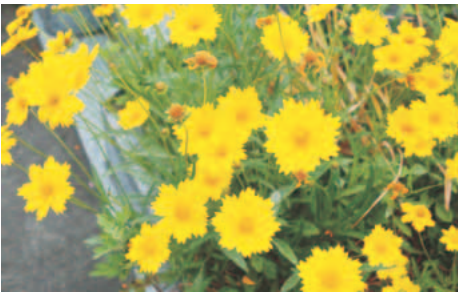
▲5月ごろから咲くオオキンケイギク