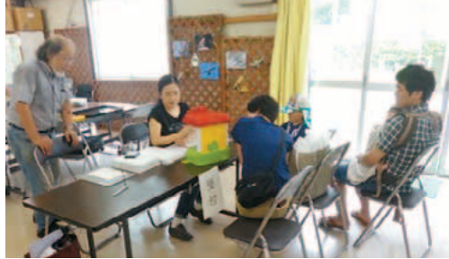
▲丁寧な診察で対応します