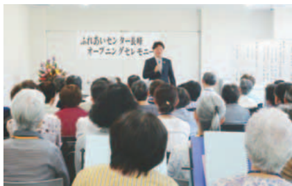
▲オープニングセレモニーの様子

平成18年に向陽台、平成24年に大丸で開設されております。ふれあいセンターの機能は、地域の中の課題を「発見」し、気軽に「相談」ができ、人が立ち寄ることで「情報」が集まり、「支援」につながるというものです。