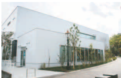
▲長峰オアシス外観

稲城市の高齢化率は東京都内では最も低い水準ですが、将来の課題を先取りして20年以上前から順次取り組んでまいりました。当初は地域センターという名称で平成9年に平尾に誕生以来、平成10年には押立・坂浜・矢野口に順次開設され、平成12年にはふれあいセンターに名称変更、平成14年に百村・東長沼、