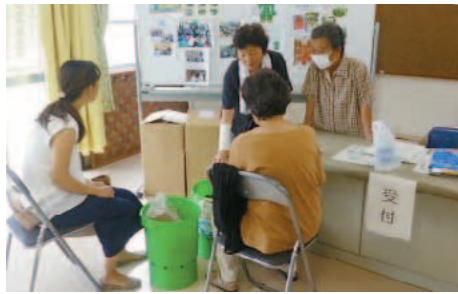
▲くうたくんで生ごみを減量しよう

▽個人負担額 3千円(市による助成後の金額) 持認印(助成金の申請に必要な) ◆共通事項 日12月8日(土) 時午前10時～正午ごろ 場環境学習センター ※車での来場はご遠慮ください(自転車の駐輪は可)。 先環境課ごみ・リサイクル係