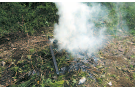
▲野外焼却は禁止です