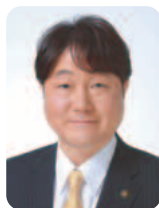
稲城市長 高橋 勝浩