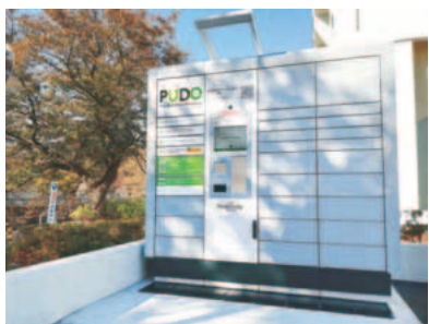
▲市役所第一駐車場南側に設置