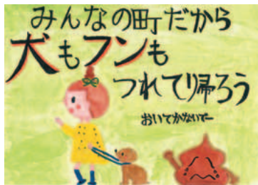
▲ポイ捨て禁止部門最優秀賞 中村 百穂さんの作品