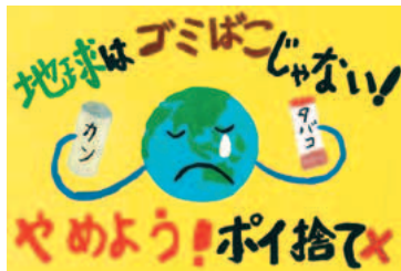
▲ポイ捨て禁止部門最優秀賞 本宿 壮太さんの作品