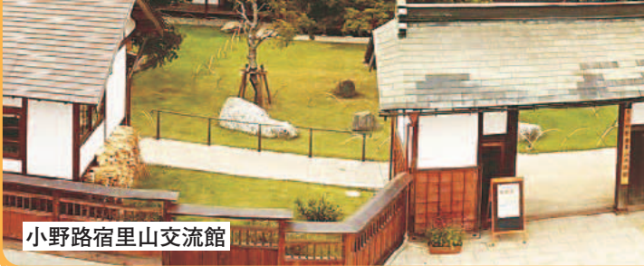
小野路宿里山交流館