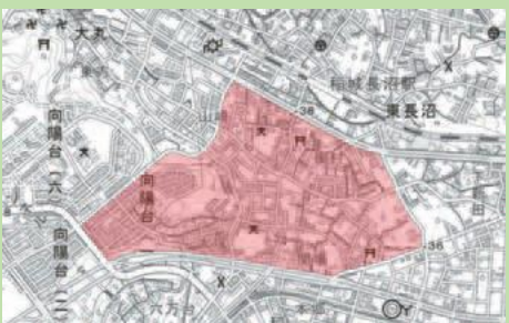
国土地理院地図を加工して作成

青渭通り(ペアリード)を中心とする百村・東長沼・大丸・向陽台地区を、新たなゾーン30に指定します。