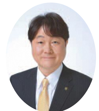
稲城市長 高橋勝浩