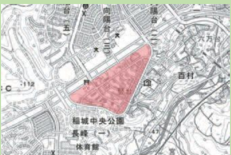
国土地理院地図を加工して作成