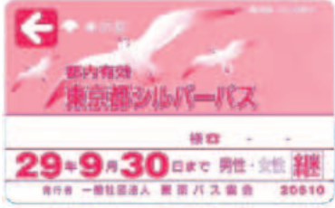
▲平成28年度シルバーパス見本