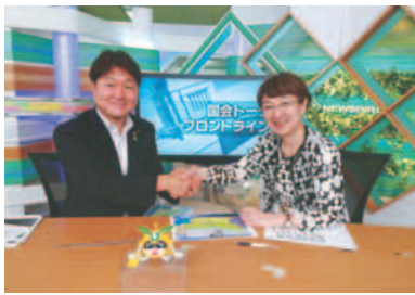
▲収録を終えての1コマ

なるほど第一の疑問は解決ですが、それでもなぜ自分に回ってきたのかは分かりません。第二の疑問をお聞きしたら、今回は介護保険制度についてテーマを絞ったことになったなと思いつつ、時既に遅し。