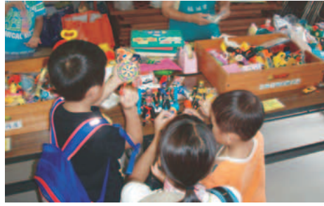
▲キッズフリーマーケットの様子

対小学生 9月11日(日) 使わなくなったおもちゃを、子どもたちが持ち寄り、世界共通のことも通貨「かえっこポイント」を使い、欲しいおもちゃと取り換えっこします。 開催します おもちゃの交換会「キッズフリーマーケット(かえっこ)」