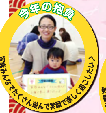
家族みんなでたくさん遊んで笑顔で楽しく過ごしたい!