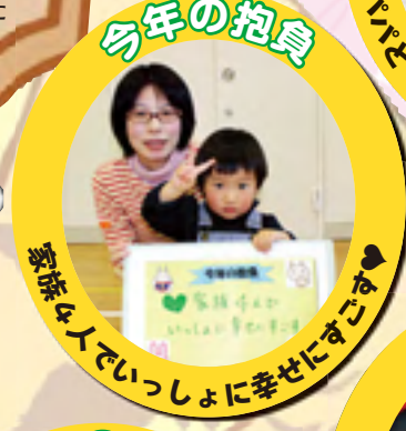
家族みんなでいっしょに幸せにすごす♡