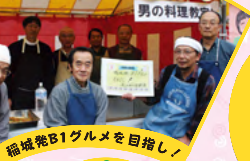
稲城発B1グルメを目指し！