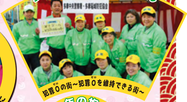
犯罪0の街～犯罪0を維持できる街～