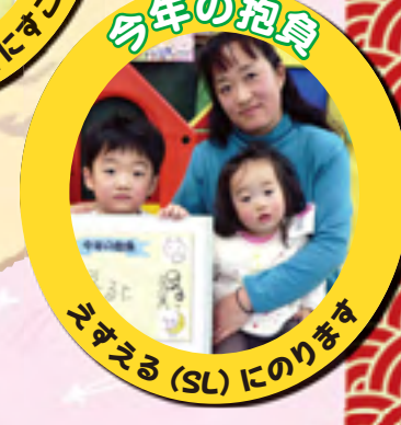
えすえる(SL)にのります