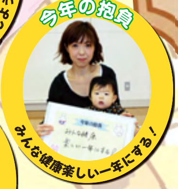
みんな健康楽しい一年にする!