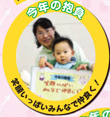
笑顔いっぱいみんな仲良く!