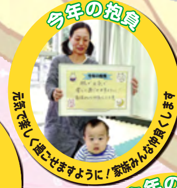
元気で楽しく過ごせますように! 家族みんな仲良くします