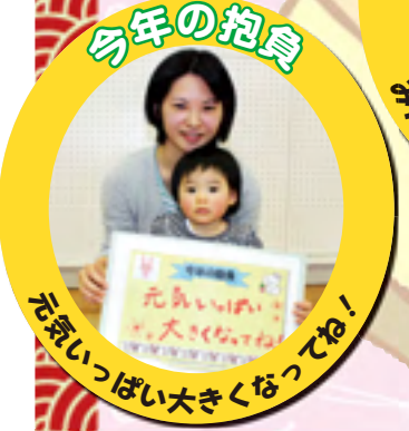
元気いっぱい大きくなってね!