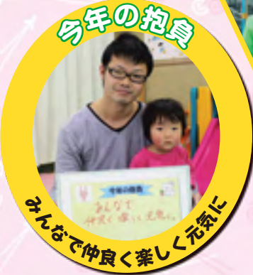
みんなで仲良く楽しく元気に