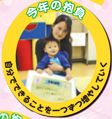
自分でできることを一つずつ増やしていく