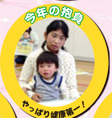
やっぱり健康第一!