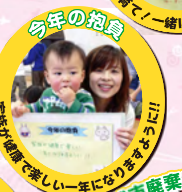
家族が健康で楽しい一年になりますように!!