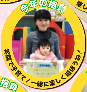
笑顔で子育て!一緒に楽しく遊ぼうね!