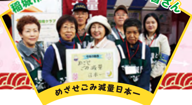
めざせごみ減量日本一