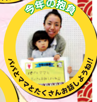
パパとママとたくさんお話ししようね!!