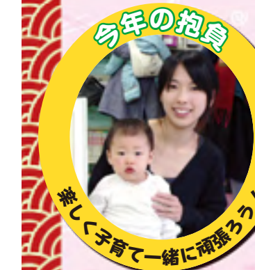
楽しく子育て一緒に頑張ろう!