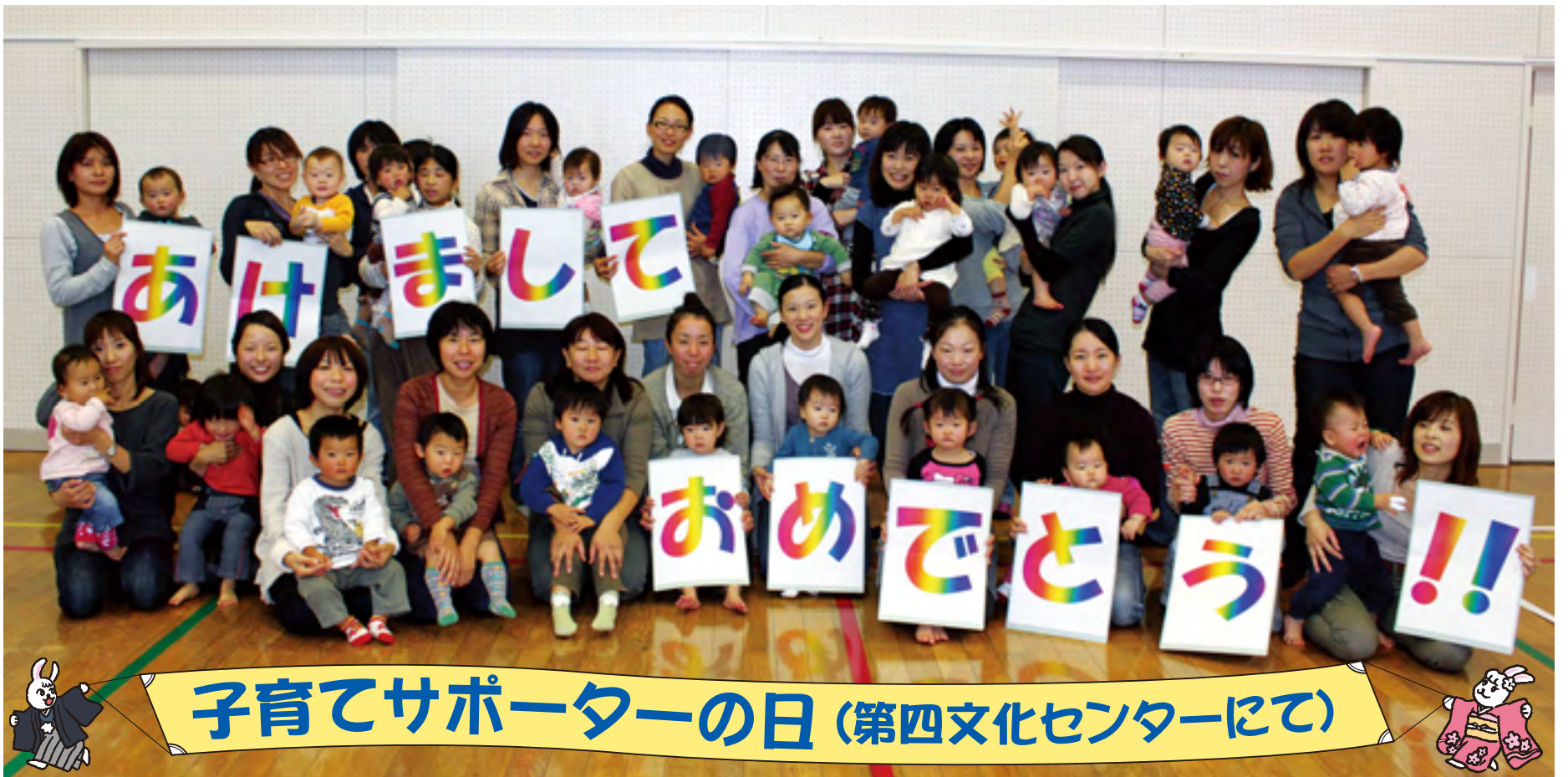
子育てサポーターの日 (第四文化センターにて)