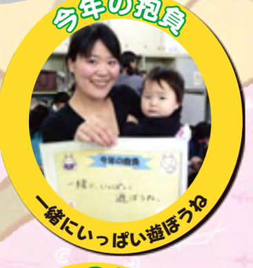
一緒にいっぱい遊ぼうね