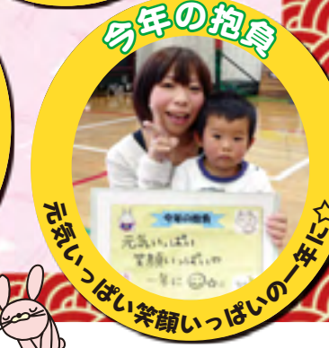
元気いっぱい笑顔いっぱいの一年に☆