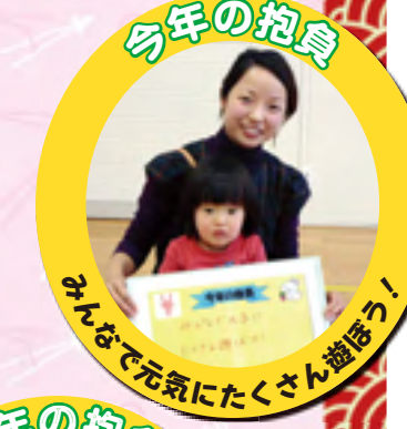
みんなで元気にたくさん遊ぼう!