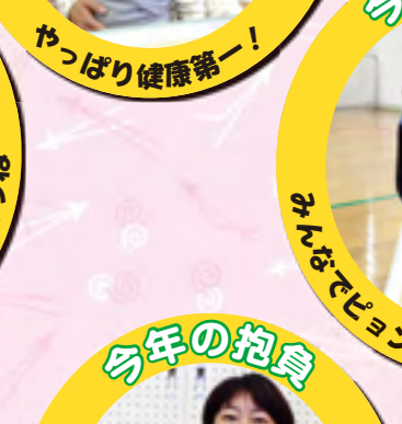
今年もみんなをたくさんつくるぞ!