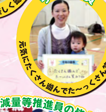
元気にたくさん遊んでた〜っくさん笑おうね