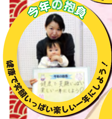
健康で笑顔いっぱい楽しい一年にしよう!