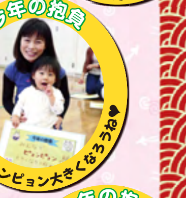
みんなでピョンピョン大きくなろうね♡