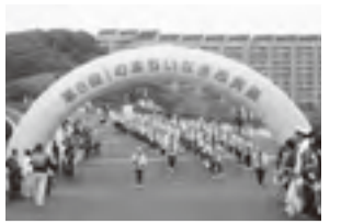
Iのまち いなぎ市民祭