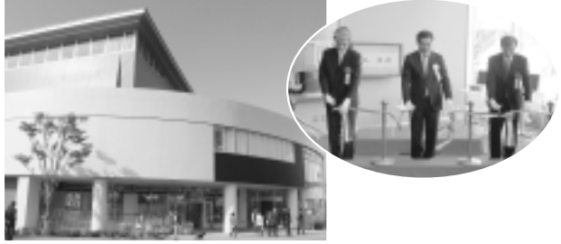
稲城市立イナギプラザ開館 10月18日・若葉台駅前) 京王相模原線若葉台駅前に稲城市立イナギプラザが開館しました。当日は、開館式典として(写真左から)いなぎ文化センターサービス株式会社宮地社長、市長、川島議長によるテープカットなどが行われました。

自分たちのまちは自分たちの手できれいに! 百村地区「まちきれ」キャンペーン 「まちをきれいにする市民条例」の啓発と実践行動を百村地区で行います。皆さん参加してください。 期日 11月29日(日) 小雨決行 時間 午前9時～11時(午前9時集合) 集合場所 百村白道ちびっ子広場(保健センター裏) 駐車場はありません。 内容 地域内の清掃活動 ごみ袋、軍手は市で用意します。 お問い合わせ 環境課環境係 全係