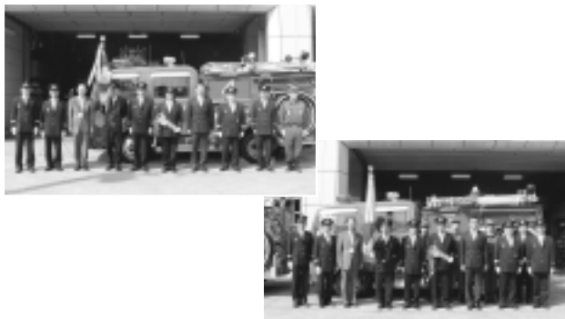
消防団に新しいポンプ車 (10月16日・稲城市消防署車庫前) 稲城市消防団の第4分団(百村)、第5分団(坂浜)に新しい消防ポンプ自動車(ポンプ車)が配置されました。この2台の配置により稲城市全分団の車両がポンネットのないキャブオーバー型に統一されました。