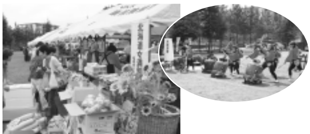
第4回ふれんど平尾まつり (10月4日・複合施設ふれんど平尾) 今年度も市民により実行委員会が組織され、ふれんど平尾まつりが開催されました。当日は、出店・催しもの・展示・ステージの各部門は多くの来場者でにぎわいました。