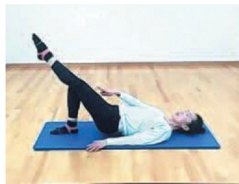
▲オンラインで楽しく運動しましょう

参加者募集 オーエンス健康プラザ 12月のオンライン教室 スタジオのレッスンは、Zoomを使用して気軽に自宅で行えます。詳細は「オーエンス健康プラザ」をご覧ください。