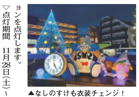
▲なしのすけも衣装チェンジ!

味の素スタジアム vsアビスパ福岡 11月25日(水) 午後6時 味の素フィールド西が丘 11月21日(土) 午後1時 味の素フィールド西が丘 東京ヴェルディ(株) ☎03・3512・1969