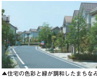
▲住宅の色彩と緑が調和したまちなみ

景観色彩ガイドラインでは建築物の屋根・外壁に使える色彩の範囲を定めています。周囲の風景に比べて突出した色彩にならないよう、地域の特徴や建築物の規模に応じた色彩の使用を促しています。建物の新築や外壁の塗り替えの際にはガイドラインを確