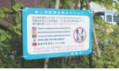
▲民有地への啓発物設置(そんぼの家S稲城長沼)