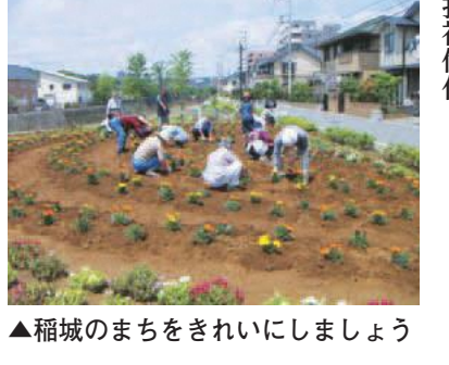
▲稲城のまちをきれいにしましょう

景観色彩ガイドラインでは建築物の屋根・外壁に使える色彩の範囲を定めています。周囲の風景に比べて突出した色彩にならないよう、地域の特徴や建築物の規模に応じた色彩の使用を促しています。建物の新築や外壁の塗り替えの際にはガイドラインを確