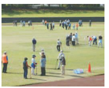
▲グラウンドゴルフ

みどりクラブは「友達が欲しい」「色々なことにチャレンジしたい」「生涯健康」等の思いで集まっているグループです。 グラウンドゴルフ・スナッグゴルフ・レクダンス等の軽スポーツ活動、カラオケや民謡、手芸、友愛活動に取り組んでいます。各クラブの活動の詳細は、市田をご覧ください。 対 おおむね60歳以上の方 申 電話 申 先 居住する地域のクラブの代表者(下表参照) 関 高齢福祉課高齢福祉係