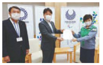
▲都知事への要請活動

わが国の感染症指定医療機関の感染症病床は、約6割を自治体病院が担っており、今回の新型コロナウイルス感染症に対しても大きな役割を果たしています。 全国自治体病院協議会が会員病院に対して実施したアンケート結果によると、新型コロナウイルス感染症患者は医療提供体制の整った大規模病院を中心に受け入れ、疑い患者を含めた中等症・軽症患者については中小規模病院も受け入れている状況が判明しました。 そして、新型コロナウイルス患者を受け入れた多くの自治体病院は、現在収益の悪化に苦しんでいます。 これまでに、政府は重症・中等症患者の受入病院に対して診療報酬を3倍とし、第二次補正予算においては「新型コロナウイルス感染症緊急包括支援交付金」を拡充し、全体で2兆2370億円を措置してきました。 また、総務省では地方公営企業の減収対策への資金手当てとして「特別減収対策企業債」の発行を認めています。 しかし、これらの措置にもかかわらず、4～6月分の減収分の補てんにさえ十分ではありません。