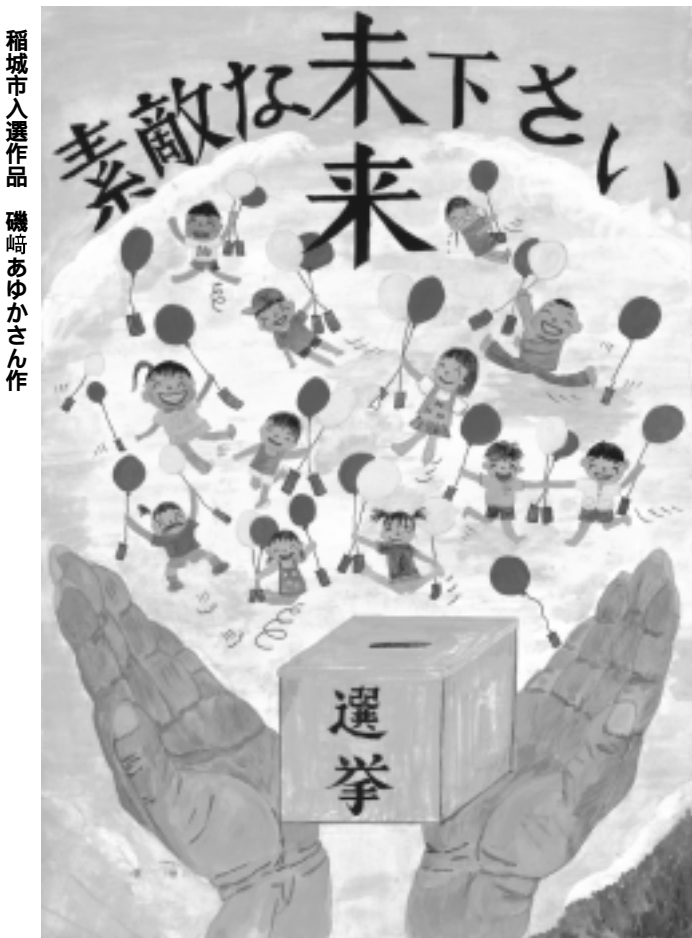
稲城市入選作品 磯崎あゆかさん作