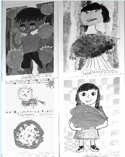
「ちぎってはって」「できたおきなやさい」

小学校低学年は、画用紙いっぱいにダイナミックな色遣いで描かれているのがとても印象的でした。