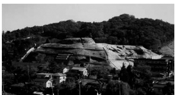
▲大丸城跡の全景(発掘調査時)

す。城跡の存在は知られていましたが詳細を記録した文献が皆無であり、字名から大丸城とされ立地条件から南北朝期の城跡とされてきました。発掘調査の結果、城跡は中央部に主郭を置く単郭式の構造で、主郭には東側に柵列跡があり、多摩川に面した西側に物見台と思われる建物跡がありました。南側には第2郭と第3郭があり、3方を溝によって区画し、その中央に小建物あるいは櫓があったと考えられています。城跡の年代は、明確に遺構に伴う遺物は少ないものの主郭部で検出された国産陶磁器や土師器等が15世紀前半を中心とする物であり、この時期以降から城として機能していたと考えら