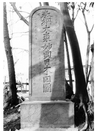
平尾原経塚の経典供養塔(稲城市指定文化財)

編集・発行 稲城市教育委員会教育部生涯学習課 〒206-8601 稲城市東長沼2111 ☎042-377-2121 042-379-0491