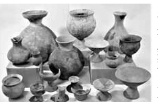
平尾台原遺跡出土土器

縄文時代の後に来る弥生時代は、中国や朝鮮などの大陸から、水稲耕作を主とした農耕や鉄器・青銅器といった金属器などが伝わってきたことにより、生活様式が狩猟採集生活から、水稲耕作による農耕生活に変化し、それに伴って文化や社会様式が大きく変化していった時代です。水稲耕作は縄文時代晩期から北九州に伝わっており、それが西日本に伝わり、東日本に伝わり、日本中に広まっていきます。