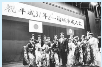
▲市長と成人式実行委員

1月14日(月・祝)によみうりランド日テレらんらんホールで成人式を開催しました。当日は、677人(市外在住者35人含む)の新成人が参加し、大人の仲間入りをした喜びを分かち合いました。