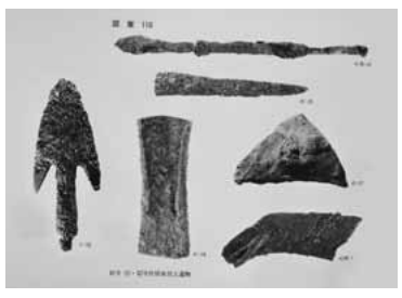
▲発見された鉄の道具