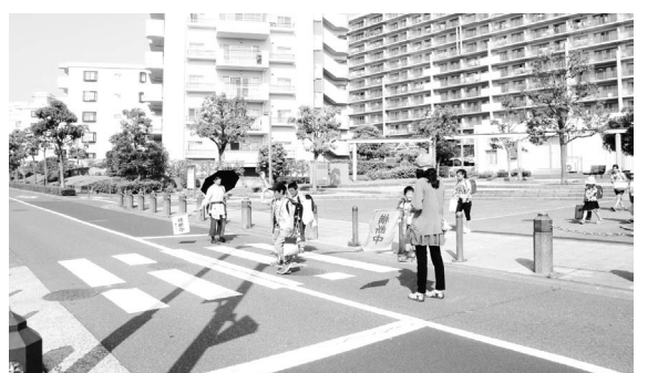
▲地域の方々による登校時の見守り

毎年十月には、「大人と子どものための読み聞かせの会」をお招きして、約1時間の公演を実施していますが、この行事も、保護者ボランティアが、手続きや連絡調整の一切を担当してくださっています。