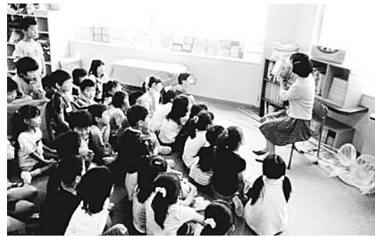
▲保護者による読み聞かせの様子

本の選定は、保護者にお任せしており、多岐にわたっています。対象学年の発達段階や興味・関心を考慮していただいています。絵本あり、童話あり、小説あり…。原則は一話完結ですが、時には何週にも渡る連続ものとなることもあります。