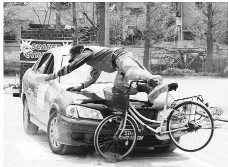
▲スタントマンによる自動車との衝突場面

第二に、新たに体育朝会を月一回設定し、全校での集団行動を統一し、クラス対抗の大なわとび、自宅で行える体づくり運動の紹介、ボールを使ったゲーム大会など、児童に様々な活動を体験させることで、運動の楽しさを伝えてきました。