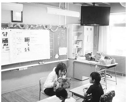
▲特性に応じて学ぶ授業