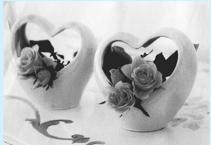
▲ハート型の器を使って生けます。(お花の種類は都合により変わることがあります。)

た協会 問合せ 川野(377)4375 パソコン講座 パソコン楽々くらぶ ▼講座・日時・内容 左表のと