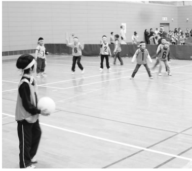
▲優勝目指してがんばろう!

毎年恒例のスーパードッジボール大会を今年も開催します。奮ってご参加ください! ▽期日 2月16日(土) ▽時間 午前9時半～午後4時(受付 午前9時～) ▽会場 総合体育館 ▽対象 市内在住の小学生 ▽競技種目 低学年の部(男女混合可)、高学年の部(男子の部・女子の部) ▽チーム編成 競技種目ごと1チーム7名登録は10名まで可 ▽参加費 無料 ▽申込み 体育課、総合体育館、各文化センター、各出張所にある申込書に必要事項をご記入のうえ、体育課またはお近くの地区体育振興会までお申込みください。申込書は市ホームページからもダウンロードできます。 ※地区体育振興会へお申込みの場合は、事前に電話にてご連絡