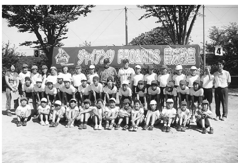
▲読売巨人軍の元選手と一緒に

当日、午前中はつつすらと雲が出て陽も陰り、ロードレース大会を実施するには少し肌寒い気候でしたが、開催決定時刻には晴れ間が見え始め、大会長の「開催!」の発声とともに準備が動き出しました。その後、各学校の先生方や各団体の方々が続々と集まり、生徒たちもスタントでレースの開始を心待ちにしていました。