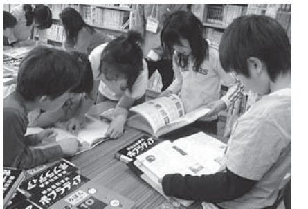
▲もっといろいろなことを自分で調べたい

四年生は、出版社の方に来ていただき、百科事典の使い方を丁寧に教えてもらい、自分たち