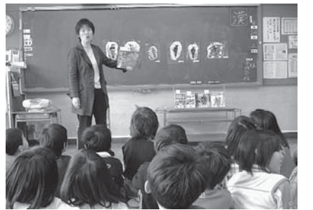
▲きつつきにもいろいろな種類があるんだね

学習後、アカゲラ・コゲラなどのきつつきの声を聞かせ、それらの絵を示しながら鳥の図鑑の紹介をしました。また、この話の載っている原本の中から一