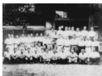
▲農地委員会の記念写真

農地改革は、日本政府が自主的に着手した第一次農地改革と不十分な改革を修正した第二次農地改革に分かれます。稲城市では昭和21年12月に農地委員会が設置され、農地改革の事業が開始されました。作業が完了する昭和25年頃までに、稲城市全体の耕地面積の約36%が解放され、小作農家の比率は激減しました。これにより地主制は解体され、自作農家の土地所有体制が確立しました。 GHQは、農地改革ならんで農業協同組合の設立を指示し