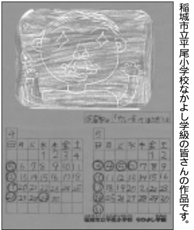
稲城市立平尾小学校なかよし学級の皆さんの作品です。

編集・発行 稲城市教育委員会 教育部 生涯学習課 〒206-8601 稲城市東長沼2111 電話 042-378-2111 FAX 042-379-3600