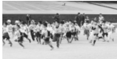
ロードレース大会

期日 12/27(土)29(日)1/4日 6火計6日間 雨天中止 時間 午前10時15分～11時15分 集合場所 総合グラウンド