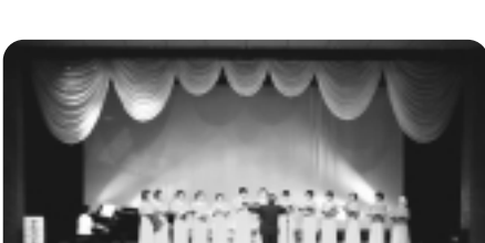
女満別女声合唱団 (北海道大空町)