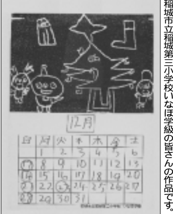
稲城市立稲城第三小学校いなほ学級の皆さんの作品です。

編集・発行 稲城市教育委員会 教育部 生涯学習課 〒206-8601 稲城市東長沼2111 電話 042-378-2111 FAX 042-379-3600