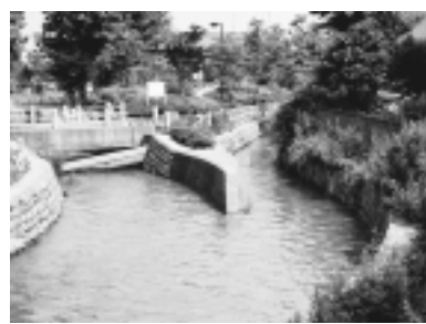
市内を流れる大丸用水

市域と川崎市域の9か村で、用水組合を組織して行われました。上流から、大丸村、長沼村、矢野口村、押立村、中野島村(以上多摩郡)と菅村、上菅生村、五反田村、登戸村(以上橋樹郡)の9村で、これらの村々は、多摩郡と橋樹郡という二郡にまたがり、領主も異なっていました。協力して運営にあたりました。用水組合の仕事は、用水堀の修繕と用水堰・入樋などの施設の修繕でした。