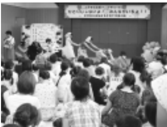
子育て応援フェスタ(昨年の様子)