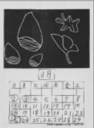
稲城市立稲城第三小学校いなほ学級の皆さんの作品です。

編集・発行 稲城市教育委員会教育部 生涯学習課 〒206-8601 稲城市東長沼2111 電話 042-378-2111 FAX 042-379-3600