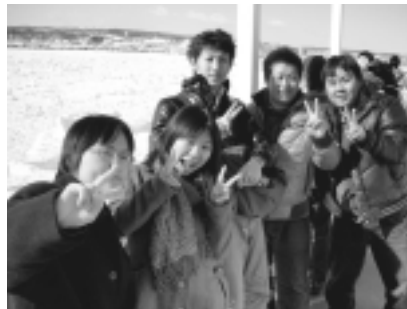
砕氷船「オーロラ号」にて

参加費 自己負担4万円程度(全費用は8万円程度ですが、1/2は市が負担します) 申込期限 12月26日金 申込・問合せ 生涯学習課 事前・事後の研修会(各1日程度)に参加していただきます。