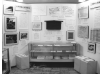
江戸時代の展示の様子

これにより、正式な行政単位として稲城市域の村が成立しました。坂浜村・平尾村・矢野口村・長沼村・百村・大丸村の六か村と押立新田で、江戸時代を通じてこの枠組みが定着していきます。