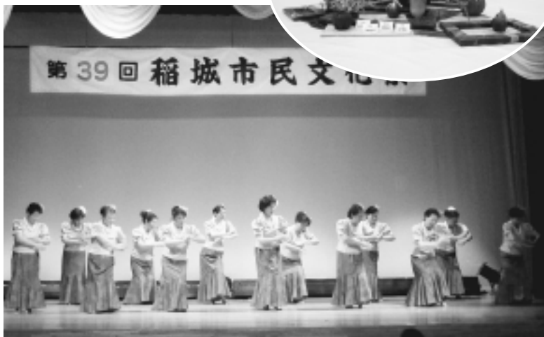
昨年度 文化祭ステージ部門(ブルメリアの会によるフラダンス)