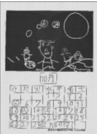
稲城市立稲城第三小学校いなほ学級の皆さんの作品です。