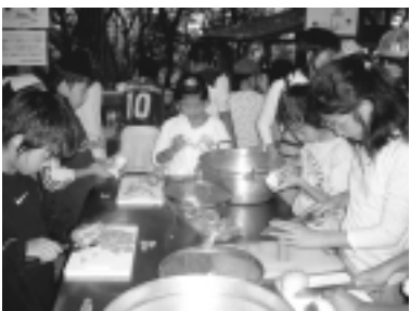
さあ カレーづくりだ!

各学校では、保護者や地域の方の協力を得ながら、1泊2日の行程で、カレーづくりやキャンプファイヤーやナイトウォークなどを行っています。この活動を通して、自分の仕事に責任をもったり、友達のことを思いやったり、友達と協力し合ったりして、集団行動のなかで、貴重な体験をしました。また、木々の緑や小鳥のさえずり、夜の長さ、ホタルの光の美しさなど、普段は、なかなか経験することができない自然に親しみ、楽し