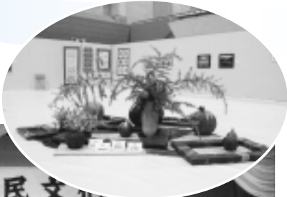
昨年度 芸術祭(いけばな)