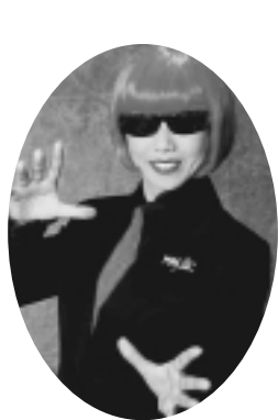
マジックジェミー