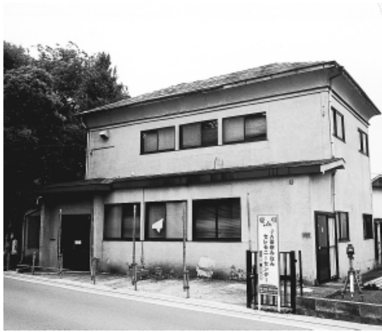
▲解体される前の旧稲城村役場の建物

教育委員会では、東長沼19番地にあった旧稲城村役場の建物を解体し、古い部材を保存しました。この建物は、明治30年に稲城村役場として建設され、その後、昭和32年に町役場が建設されたからは、農協に払い下げられ、農協・消防署・福祉事務所・商工会として使われてきました。今回の解体作業では、将来復原することを念頭に、古い部材