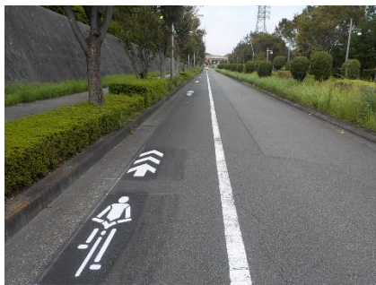
自転車ナビマークの例

自転車と自動車が車道で混在。自転車の通行位置を明示し、自動車に注意喚起するため、必要に応じて路肩のカラー舗装、帯状の路面表示や自転車ナビマーク、ナビラインを設置