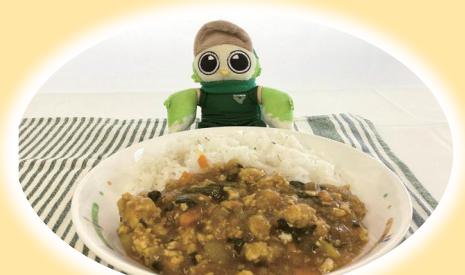
ほうれん草入りキーマカレー

そして何よりも「おいしい給食を食べてもらいたい」という想いを込め、子どもたちの笑顔を思い浮かべながら作っていることが、おいしさにつながっているのだと思います。