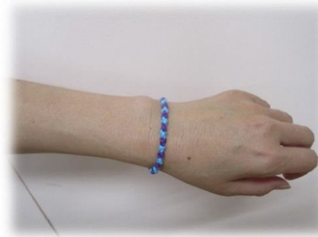
はじめての人でも作れるよ◎