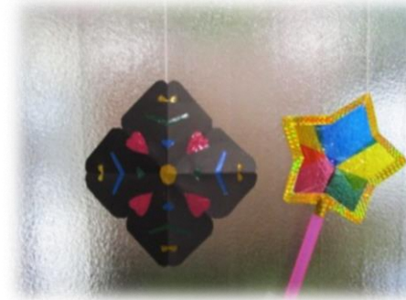
太陽の光を当てると、きれいな模様が見えるよ

<児童> 8/15(木) クラフトの日 セロファンステンドグラスとキラキラスティック作り