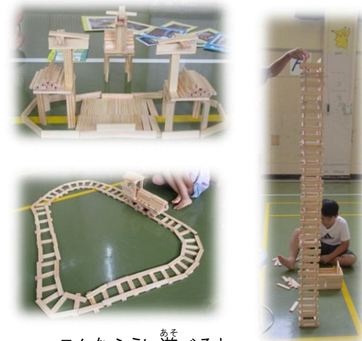
こんなふう遊ぶよ