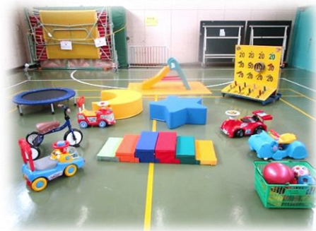
こんな遊具で遊べます